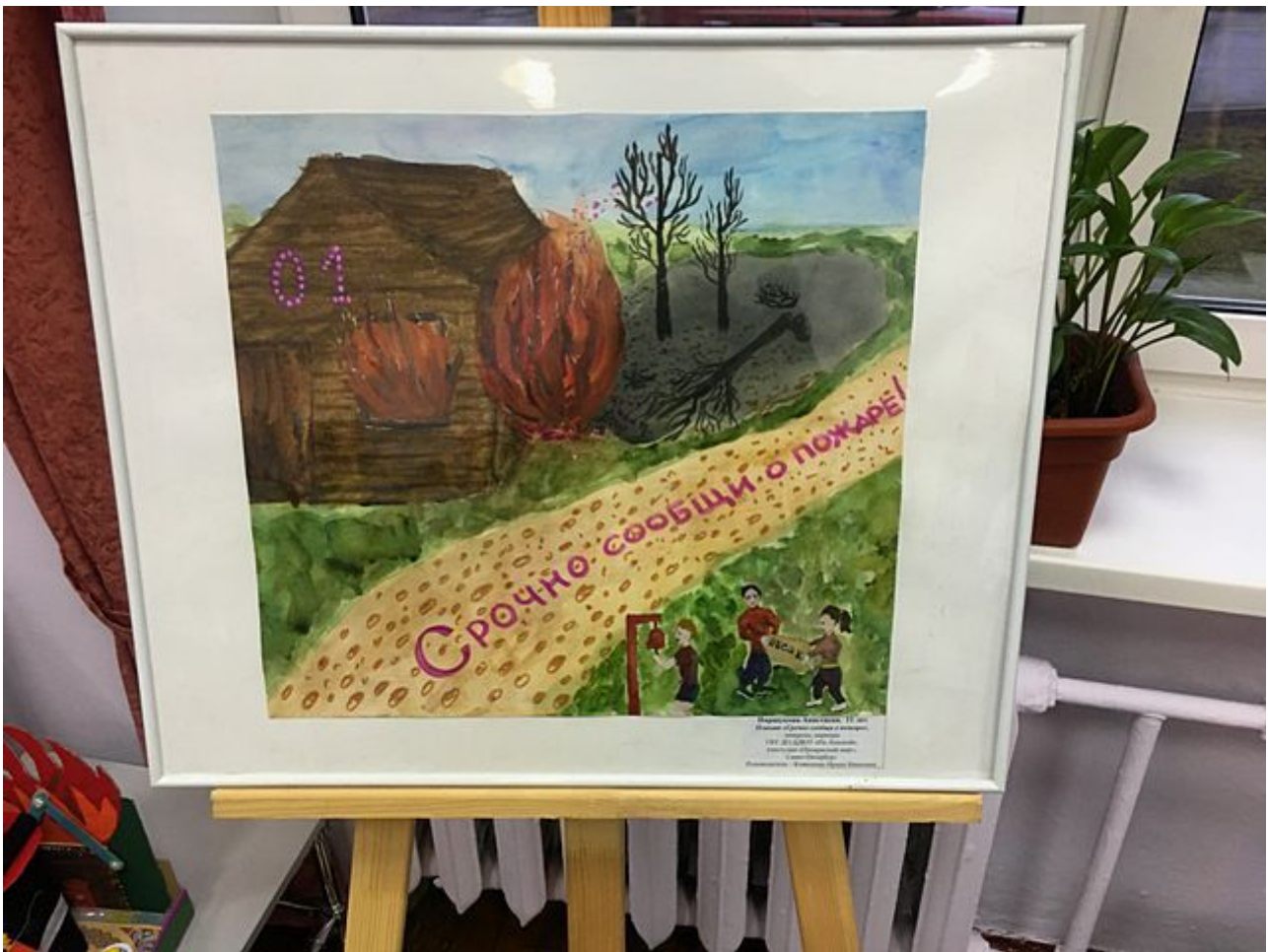
Иллюстрация: М.А. Сидорова, 11 лет. Срочно сообщите о пожаре! 112 - это служба спасения. Спасательная служба. Внимание! Срочно сообщите!