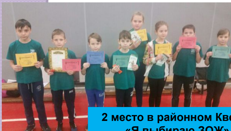
2 место в районном Квесте «Я выбираю ЗОЖ»