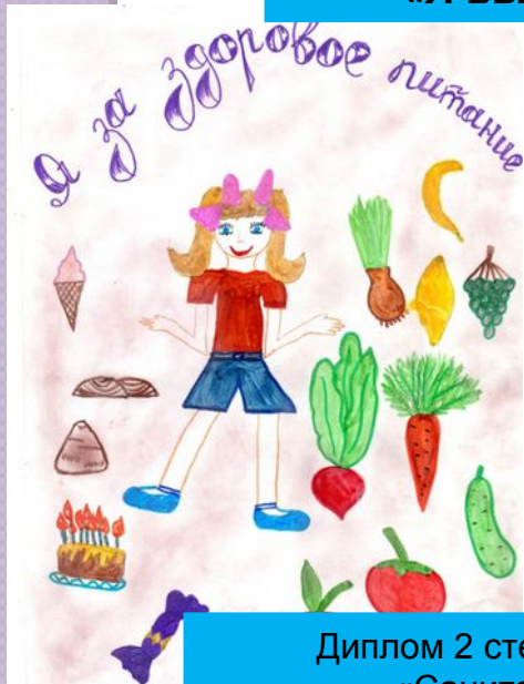
Диплом 2 степени в номинации «Санитарный плакат»