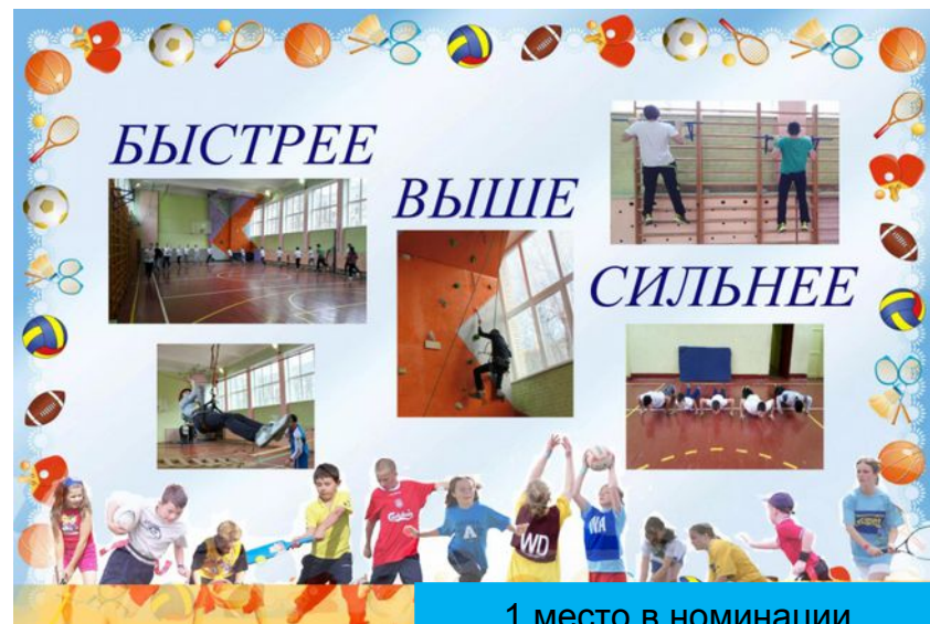
1 место в номинации «Компьютерный коллаж»